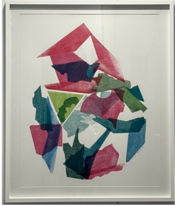
Sibel Kırık 'Organized Confusion' , 2024 ahşap gravür 98 x 82 cm (çerçevesiz) unique