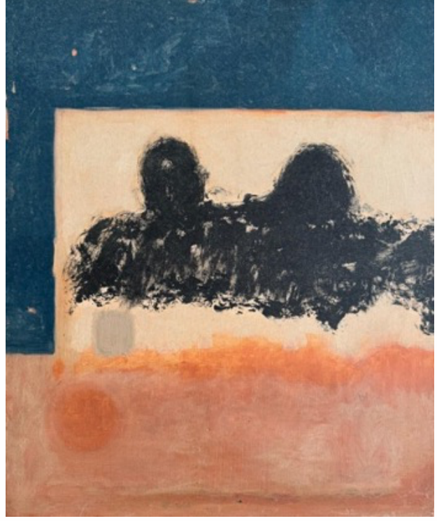
Dilara Göl 'Bekleyiş' , 2024 tuval üzeri yağlı boya 60x50 cm