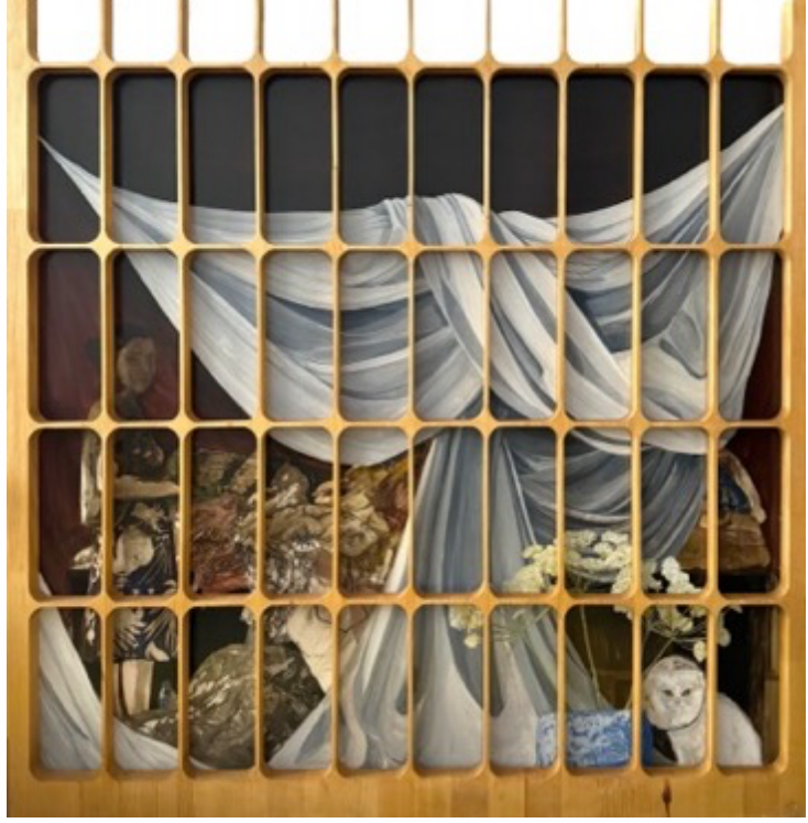
Begüm Mütevelliođlu 'Queen Anne's Lace', 2024 kađıt ¼zerine yađlı boya 118x116 cm (¼er¼eveli)