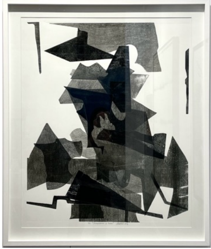
Sibel Kırık 'Incompleteness of Nature' , 2024 ahşap gravür 98 x 82 cm (çerçevesiz) unique