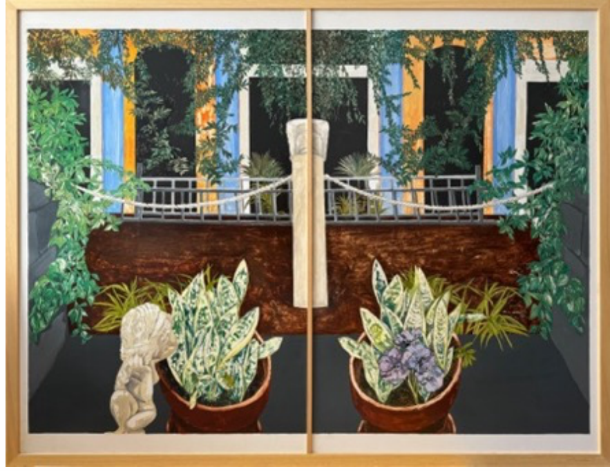
Begüm Mütevellioğlu 'Fling' , 2024 kağıt üzerine yağlı boya 102x107 cm (çerçevesiz)